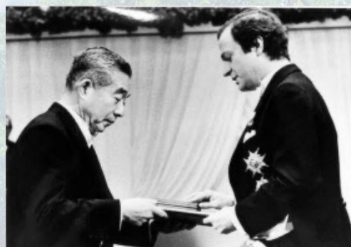
アジア初のノーベル化学賞を 受賞された福井謙一博士

必須ではありませんが、参加人数把握のため、 上記まで連絡をいただくと助かります。